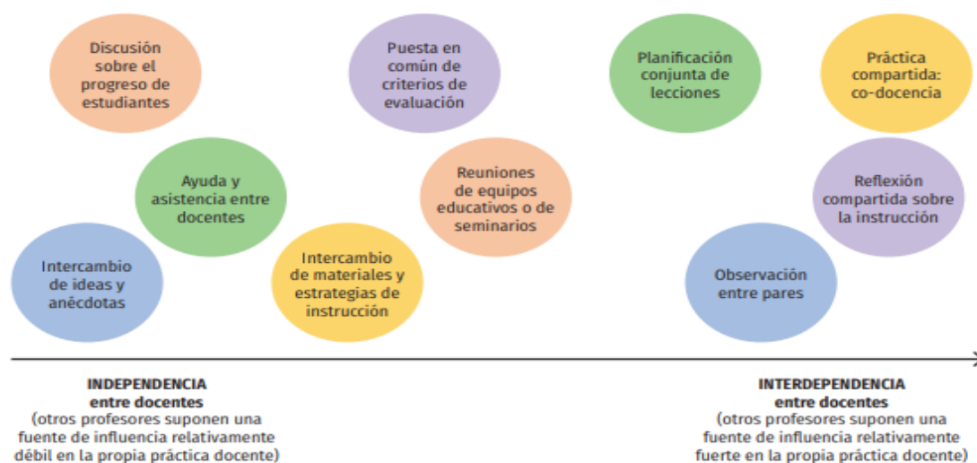
1 Marco conceptual basado en Little

Fuente: Autor: Martínez, O. Eva, Flavia (Sf.) Relaciones de colaboración entre docentes (Marco conceptual basado en Little, 1990)