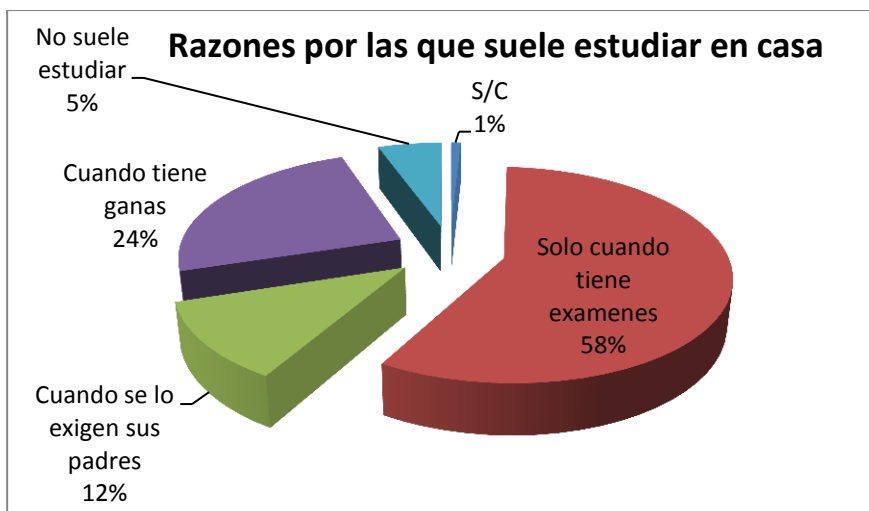
Grafico No. 1 Razones por las que suele estudiar en casa

En la descripción de los resultados según se muestra en la Tabla 4, referente a la armonía que existe en el aula entre los estudiantes , 602(72%) expresó que siempre se llevan muy bien entre sí, 234(28%) expresó que nunca o raras veces; con referencia a la relación que existe entre los profesores 627(75.1%) dijeron que siempre se llevan bien, 209(24.9%) expresaron que nunca o rara vez se llevan bien entre sí; un dato significativo es que 315(37.6%) estudiantes, expresaron que nunca o rara vez los profesores se interesan por los estudiantes, los escuchan y dan consejo y 521(62.4%) dijeron que casi siempre ó siempre; 298(35.7%) estudiantes manifestaron que nunca o rara vez, cuando surge una situación de violencia escolar hay alguien para ayudarles, 538(64.3%), manifestaron que casi siempre o siempre; otro dato importante de destacar es que 244(29.2%) dijo que nunca o rara vez conocen las normas de convivencia del centro educativo; mientras que 592(70.8%) expresaron que casi siempre y siempre las conocen (ver tabla 4).