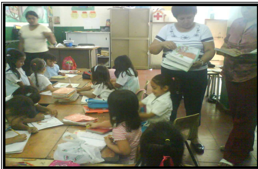
La maestra hace entrega de libretas de trabajo a los niños y niñas.