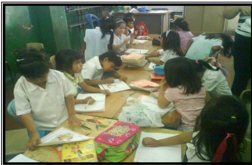
Los niños y niñas trabajan en apresto (dibujo libre).