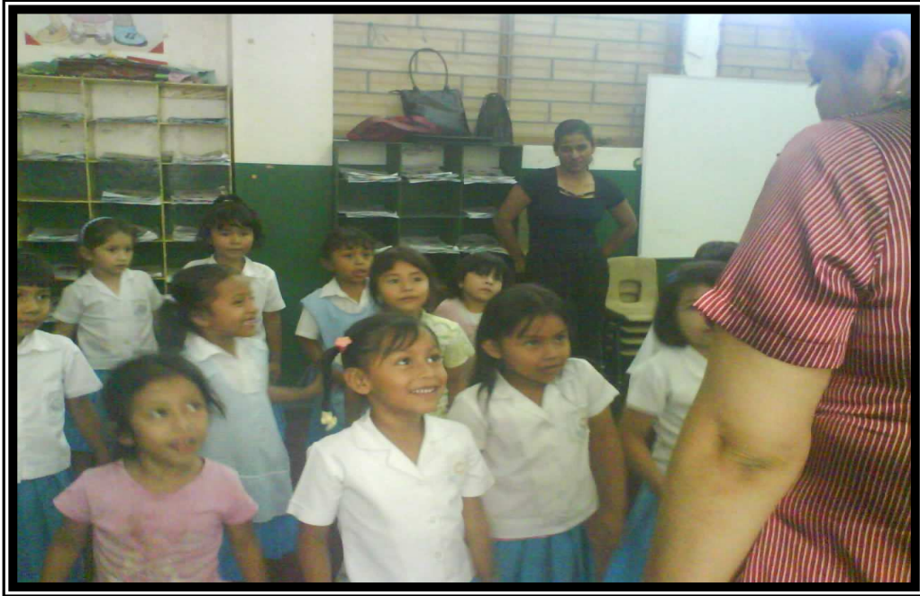
El grupo de investigación realiza cantos autorizados por parte da la maestra.