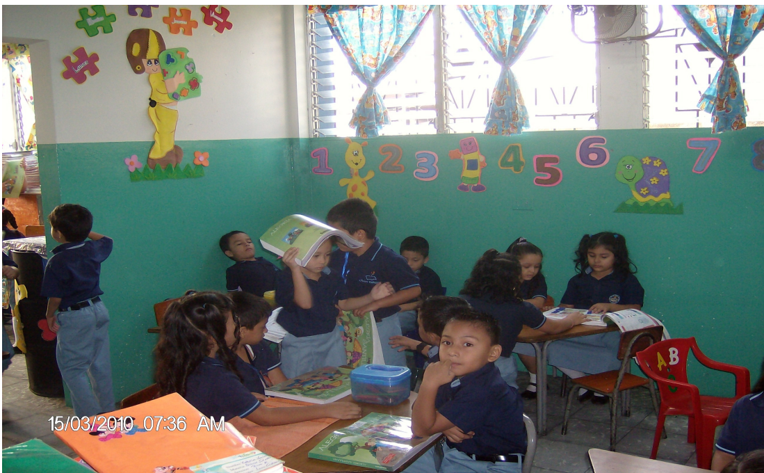
La niña se dirige en ese momento a golpear a su compañero por la falta de atención del mismo.