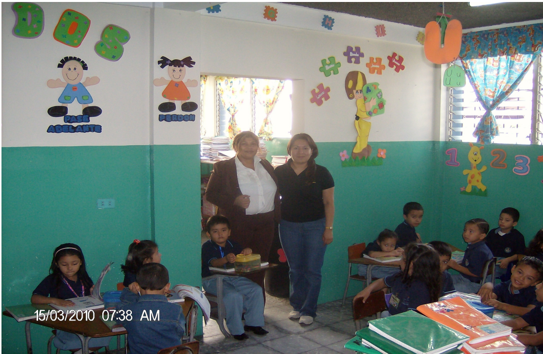
La observación fue continua en cada una de las sesiones de la investigación.